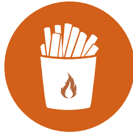
POMMES ODER CURLY FRIES